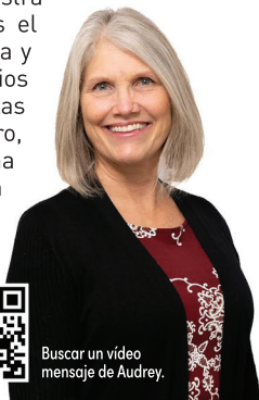
Audrey Folkenberg Stewardship | Planned Giving & Trust Services

De sábado a sábado, oro para que sintamos su amor de nuevo y volvamos a dedicar nuestras vidas a vivir fielmente para Jesús. Oro para que los sábados anulen nuestras tendencias a distraernos de los planes de Dios para nuestra felicidad. Entonces, abracemos el sábado y todo lo que representa y comprometámonos a elevar a Dios con todo lo que tenemos: con las habilidades, el tiempo, el dinero, las relaciones, etc., que nos ha dado. Vivamos para honrar a nuestro Creador y, con Sus dones, hacer crecer Su Reino.